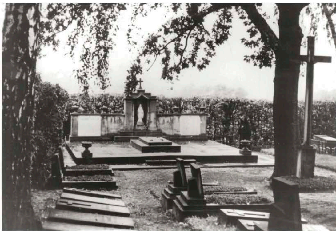
Le cimetière du Couvent à Cracovie-Łagiewniki. Après les obsèques, la dépouille de sœur Faustine y fut déposée dans le caveau commun le 7 octobre 1938. En 1966 ses restes furent transférés dans la Chapelle. De nos jours ils se trouvent sous l'autel, au pied du célèbre tableau de Jésus Miséricordieux, source de grâces.