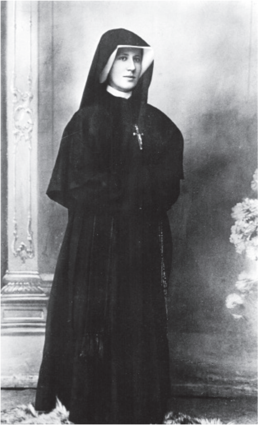
Photographie de Sœur Faustine prise à Płock en 1931